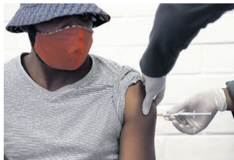
A vaccine volunteer gets an injection at the Chris Hani Baragwanath hospital in Soweto, Johannesburg Wednesday, June 24, 2020.